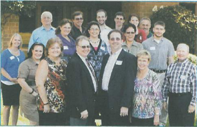
Das Hager Worldwide Vertriebs-Team

Weitere Informationen zu Hager & Werken und seinen Produkten finden Interessenten im Internet unter www.hagerwerken.de . ▼