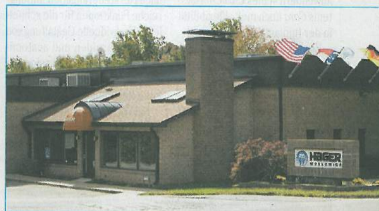
Neuer Hauptsitz von Hager Worldwide in Hickory, North Carolina